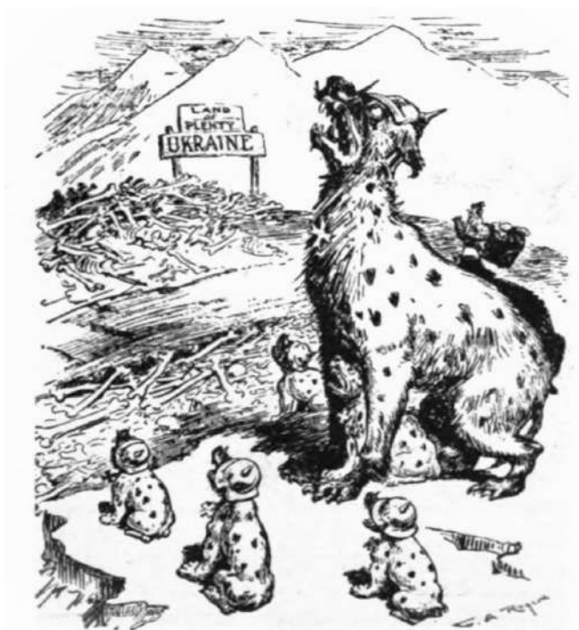
Рис. 4. Карикатура «Нічого крім сухих кісток» [15].

Ще один американський художник-карикатурист В. А. Роджерс, автор серії антинімецьких карикатур періоду Першої світової війни, вдався до виразної алегоризації, надаючи німецькій політиці щодо України «тваринних» рис. У його роботі «Нічого крім сухих кісток» [Рис. 4] німецькі солдати постають в образі гієн, що сидять перед всіяним кістками полем, позначеним як «Україна – земля достатку». Така візуалізація формує уявлення про Україну як об'єкт виснажливої експлуатації та водночас підкреслює сприйняття німецької політики виключно в деструктивному ключі.