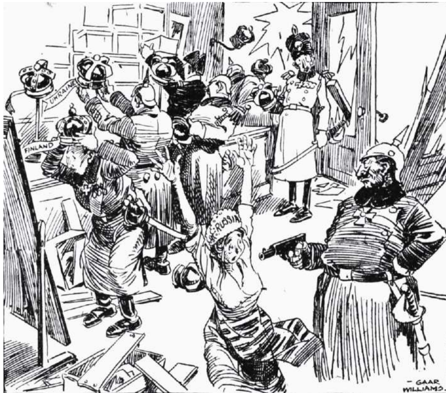
Рис. 2. Карикатура «Весняні капелюшки» [34].