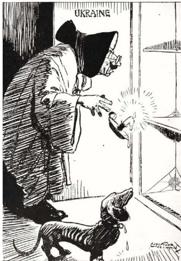
Рис. 3. Карикатура «Німецька матінка Габбарт» [27].